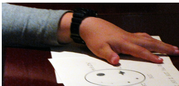
Figura 2: Ejemplos de láminas en relieve usadas en las conferencias para la transmisión de conceptos espaciales relacionados con la astronomía.

Los talleres tienen como objetivo motivar el estudio de la astronomía para todos los públicos desterrando la idea de que ésta sólo se puede estudiar por medio del sentido de la vista. También se hace una descripción de distintos astros y sus tamaños y distancias relativas por medio de ejemplos y del material adaptado. Finalmente se realiza una visita guiada a través de algunas de las principales constelaciones del hemisferio norte mediante el uso de semiesferas con relieves de las mismas.