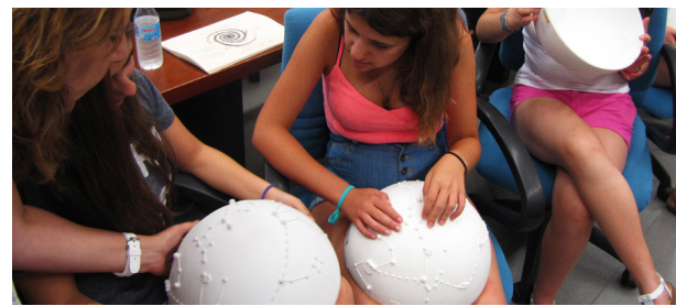
Figura 3: Imágenes de los elementos en tres dimensiones que se utilizan en los talleres para la transmisión de conceptos espaciales: La primera imagen modelo de la Luna. La segunda imagen, modelo de una semiesfera con las constelaciones del hemisferio norte.