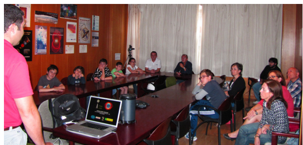
Figura 1: Imágenes de algunas de las conferencias y talleres impartidos durante el año 2015: arriba; Asturias y abajo: Granada.